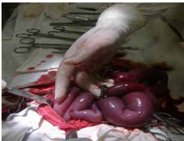
Рис. 1. МИТ, перфорировавшие подвздошную кишку

Пациент 2 лет госпитализирован 28.09.2014г., через 3 часа с момента проглатывания МИТ. Мама заметила, что ребенок проглотил неодимовые шарики от конструктора. При поступлении выполнена обзорная рентгенограмма брюшной полости, на которой выявлено 15 МИТ, расположенных цепочкой в пищеводе и желудке (рис. 3). Под эндотрахеальным наркозом выполнена ФГДС, при которой с большим трудом, так как часть магнитов, попавших в желудок, притянулись к тем, что были в пищеводе, и зажали угол Гиса, были извлечены МИТ. Через сутки выписан домой.