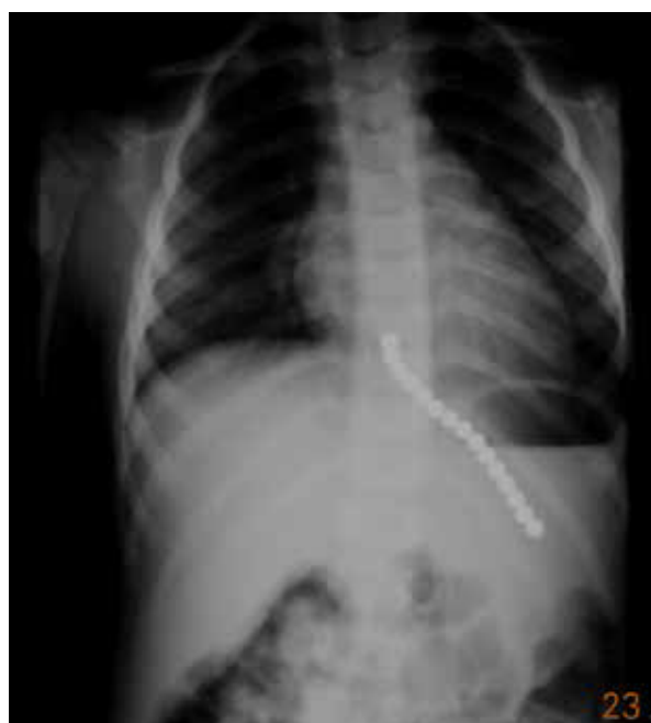
Рис. 3. Обзорная рентгенограмма брюшной полости мальчика 2 лет