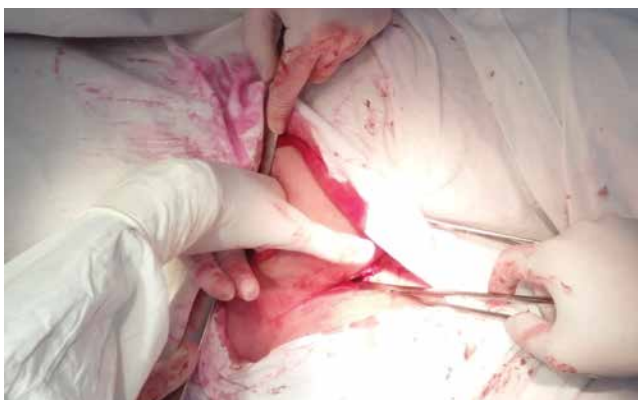
Рис. 9. Інтраопераційне фото (формування неврального каналу)