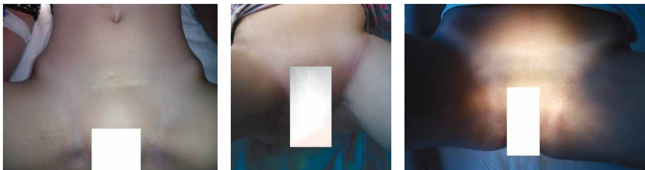
Рис. 15. Видгляд післяопераційних рубців