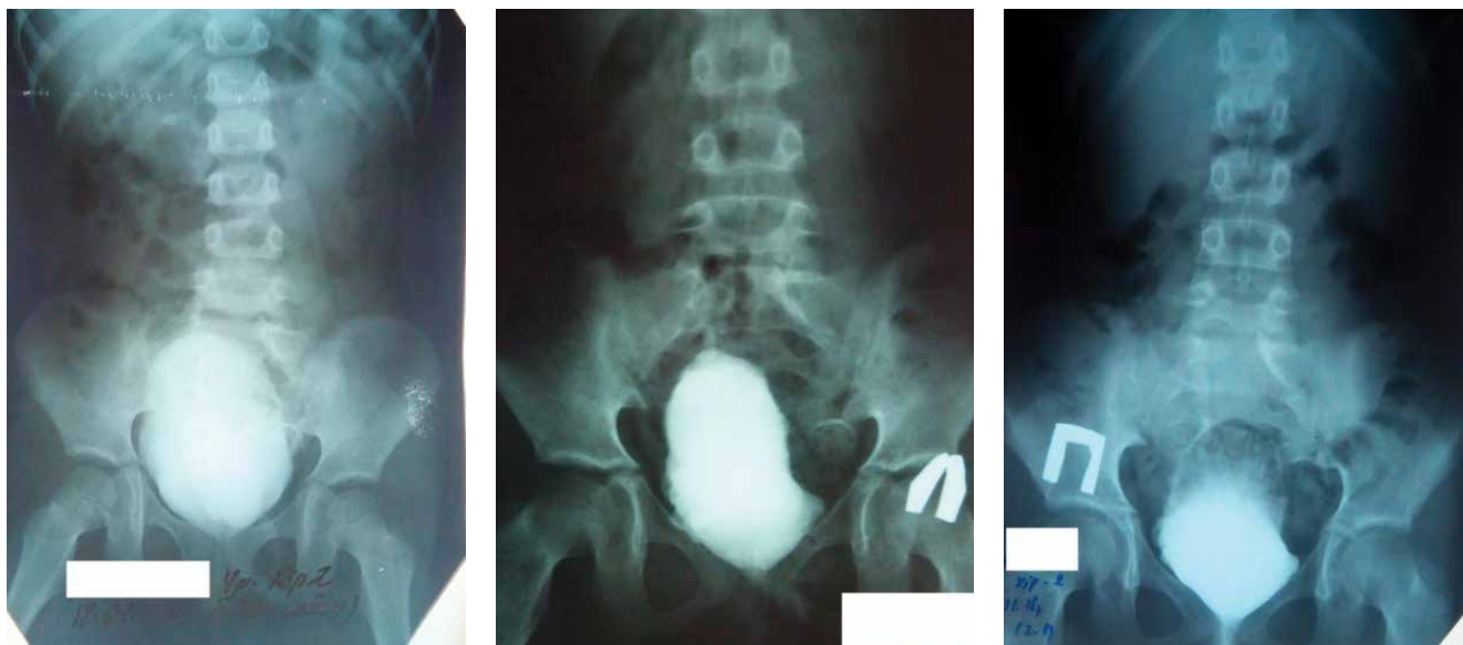
Рис. 14. Результати цистографії до операції (зліва) – наявний міхурово-сечовідний рефлюкс зліва та після операції (по центру та справа) – міхурово-сечовідний рефлюкс відсутній