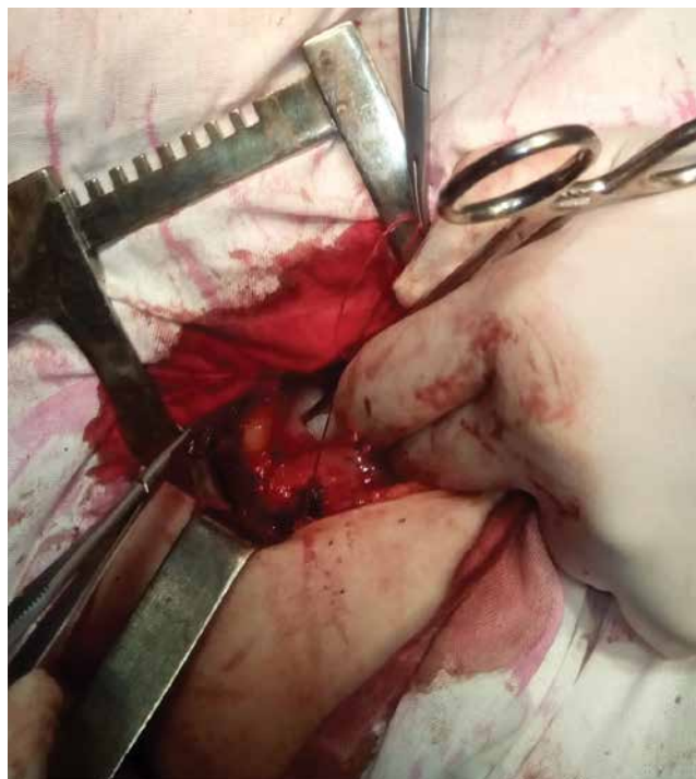
Рис. 10. Інтраопераційне фото (переміщення нерва в порожнину малого тазу)