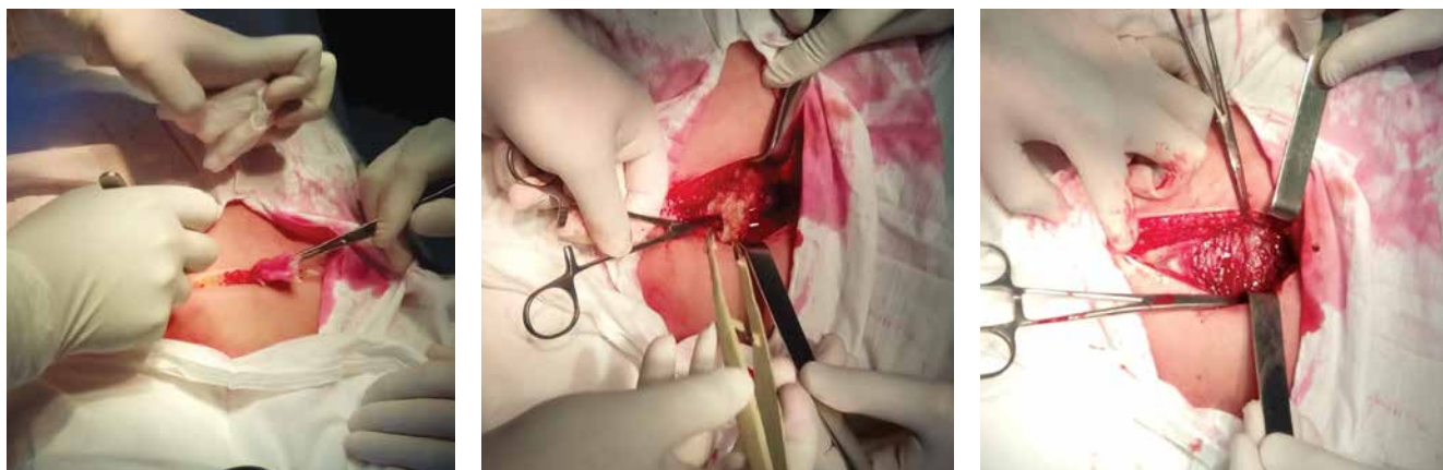
Рис. 1–3. Інтраопераційне фото (доступ до сечового міхура)