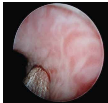
Рис. 13. Етап операції введення об'ємуючої речовини в ділянку шийки сечового міхура

після розсічення серозної оболонки формується детрузорно-уротеліальна ділянка, в яку вшивається нерв (шовний матеріал, що піддається розсмоктуванню, не товщий за 7/0). Місце вшивання нерва