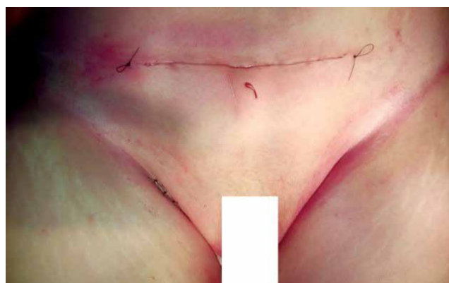
Рис. 12. Вид післяопераційних ран